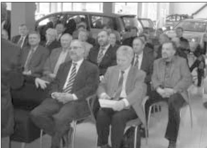
Rotariečiai nekantriai laukė bandomųjų važiuojimų

Gal neįprasta susirinkimui vieta, o gal ir malonius išpūdžius žadantis vakaras, į šį susirinkimą paviliojo net 45 klubo narius, turėjusius neeilinę galimybę tapti pirmaisiais, galėjusiais išbandyti naujausią „Hyundai“ verslo klasės limuziną „Grandeur“, Lietuvą pasiekusį vos prieš keletą dienų ir pasižymintį ypač gera važiuojimo kokybe bei tylia variklio darbu; visiškai naują, tik prieš keletą valandų Lietuvą pasiekusį antros kartos „Santa Fe“ visu-reigį; bei daugeliui jau gerai žinomą penktos kartos kultinę „Sonatą“, kuri prieš mėnesį pelnė prestižinio Suomijos automobili-