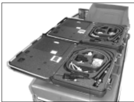
Bronchoskopas tuberkuliozės ligoninėms Kauno RK nupirko su apygardos 1460 Koldingfjord RK pagalba