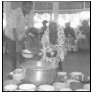
Rotary viena nedaugelio organizacijų, kurioms leidžiama teikti paramą krizės ištiktoje Zimbabvėje

darbo. Po to, kai vyriausybė atėmė žemę iš baltosios rasės Zimbabvės gyventojų, daugelis ūkių buvo tiesiog sunaikinti. Tuo tarpu miestuose vykdomas atnaujinimo planas be pastogės paliko tūkstančius gyventojų.