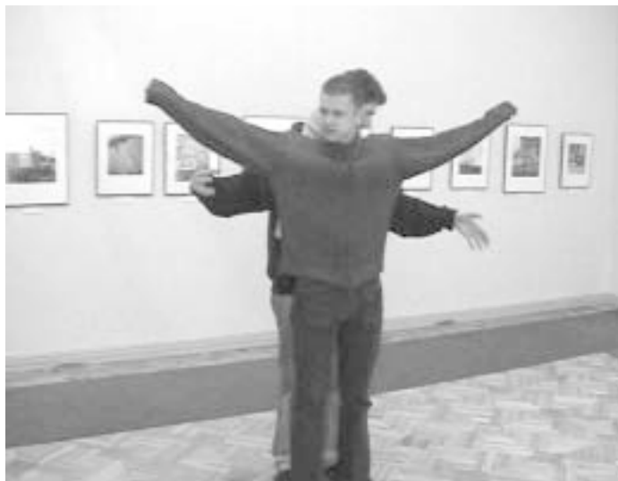
Patraukliai pateiktos edukacinės programos į meno pasaulį įtraukia pačius vaikus