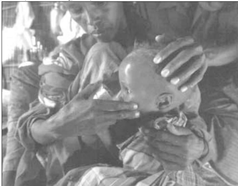
Sausros kankinamoje Etiopijoje trūksta ir maisto, ir vandens.