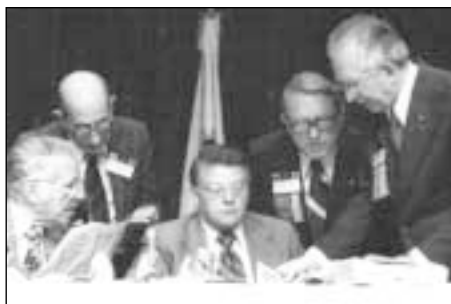
1977 m. vykusiame Rotary Parlamente rotariečiai taip pat ugdė derybinius įgūdžius.

Pirmaisiais organizacijos gyvavimo dešimtmečiais kova dėl Rotary posto panašėjo į politines batalijas. Klubai bei apygardos, norėję matyti savo atstovą apy-