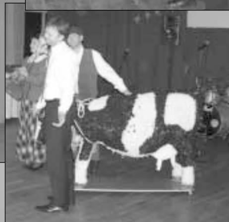
Ukmergės RK švenčia dešimtąjį jubiliejų. 2006 m. lapkričio 25 d.