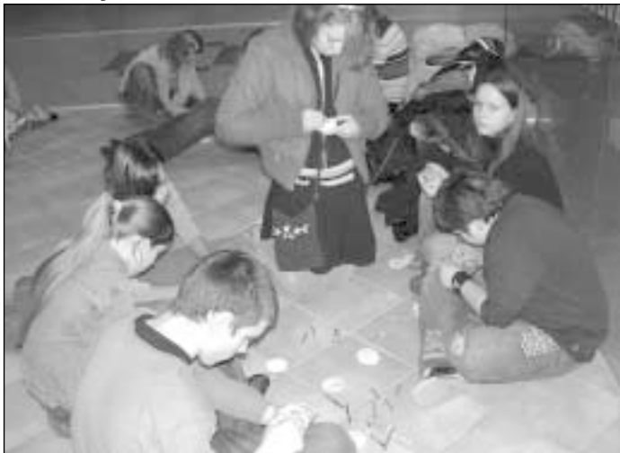
Devyni šimtai vaikų pieštų šventinių skritulių papuošė Megaplasos centre stovinčią Kalėdų eglę

svarbiausia, jog žmogus gerai jaučiasi, net jei gali paaukoti tik litą ar du. Tikimės, kad šia idėja „užkrėsti“ pavyko ir į muzikinius pasirodymus įtrauktus vaikus“.