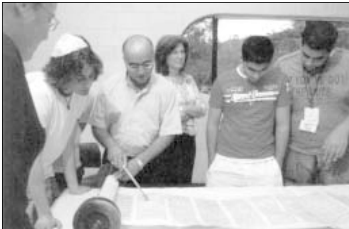
Studentai studijuoja žydų šventraštį – Torą – Brandeis Bardin Institute

Dvi savaites trukusioje stovykloje JAV jaunuolių laukė įtempta darbotvarkė. Rytais dažniausiai prasidėdavo 6 valandą jogos užsiėmimais. Dienomis jų laukė komandos formavimo užduotys, pamokos vietinėse mokyklose, bendravimas su Rotary klubų nariais, rabinais, pastoriais ir imamais. Kiekvienos dienos pabaigoje savo mintis jie surašydavo žurnaluose.