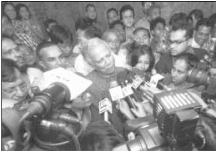
Žurnalistų apsuptyje Nobelio premijos laureatas M.Yunusas

2006 m. Nobelio taikos premija už mikrokreditų idėją bei sėkmingą jos populiarinimą pasaulyje įteikta Bangladešo ekonomistui Muhammadui Yunusui.