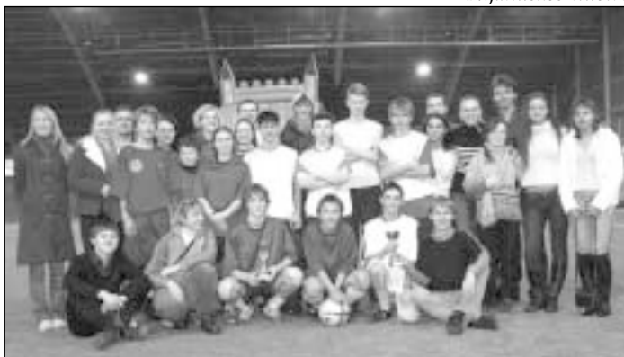
Vilniaus ir Minsko Rotaract nariai žada pasistengti, kad pirmosios varžybos būtų tikrai ne paskutinės