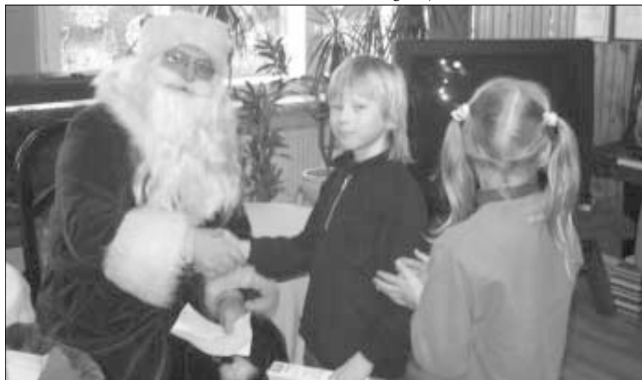
Ratnikų šeimynai vienintelis tikras Kalėdų senis yra tas, kuris atvyksta su rotariečiais