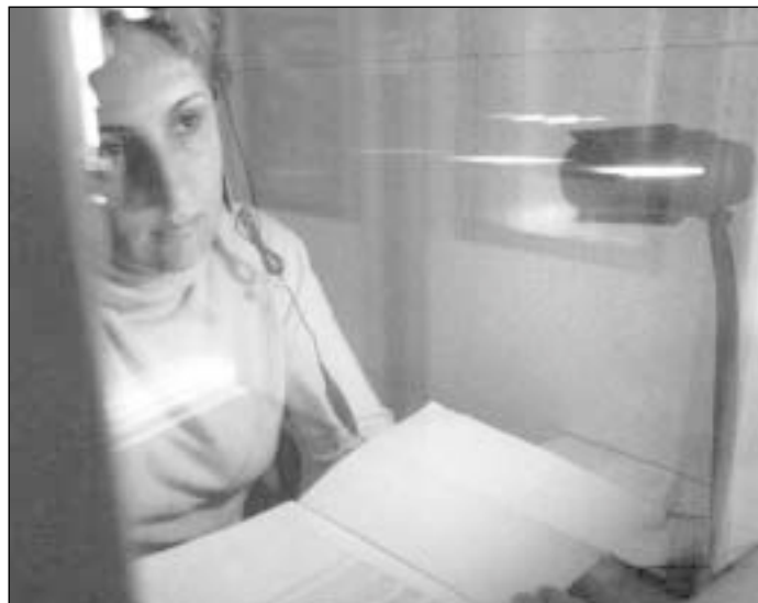
Garso nepraleidžiančios kabinos užtikrins aukštą Rotary ir Rotaract narių garsinamų knygų įrašymo kokybę

Knygų įgarsinimui reikalingą įrangą rotariečiai įsigis remiami Rotary Fondo. Istanbul-Fidikli RK pateikė paraišką Matching Grant projektui ir iš Fondo bei klubo partnerių gavo 38,9 tūkst. JAV dolerių paramą.