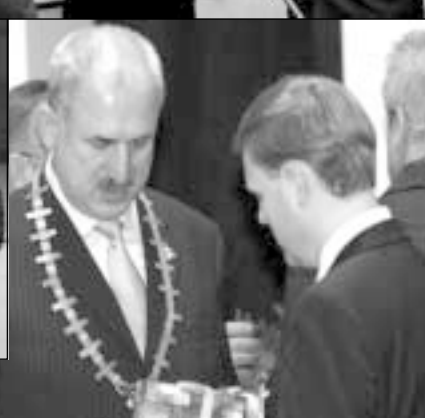
Tauragės RK dešimtojo jubiliejaus vakaras. 2006 m. lapkričio 25 d.