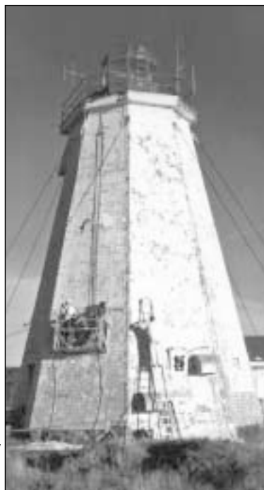
147 metus skaičiuojantį švyturį rotariečiai atstatė ir įvardijo Rotary Šimtmečio projektu

Jei norite puikiai praleisti laiką drauge su broliais rotariečiais, apsilankykite Grand Manan Island RK. Klubo susirinkimai vyksta didžiausioje saloje Bay of Fundy regione, kuris yra gerai žinomas dėl potvynių bei atoslūgių, du kartus per dieną pakeliančių vandens lygį dešimčia ir daugiau metrų. Tai taip pat viena geriausių vietų stebėti banginius. Jei norite patirti nepakartojamų išpūdžių stebėdami šiuos milžinus, planuokite savo ke-