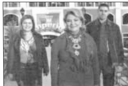
Giza RK nariai dar laukia pirmojo svečio iš užsienio.