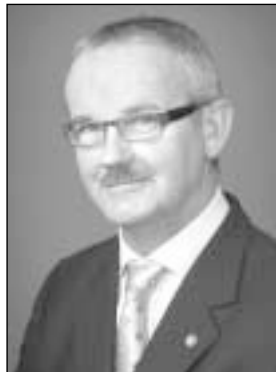
Rotarietis nuo 1999 m. Aarup RK narys