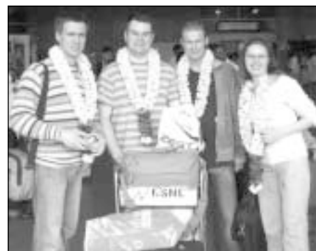
Rotariečiai oro uoste svečius pasitiko su gėlių girliandomis

Tik atskridę, nuvykome į vieną geriausių Madraso klubų, kur mums koordinatorius pristatė visą viešnagės programą. Iškart buvo matyti, kaip profesionaliai ir atsakingai ji parengta. Visos kelionės metu