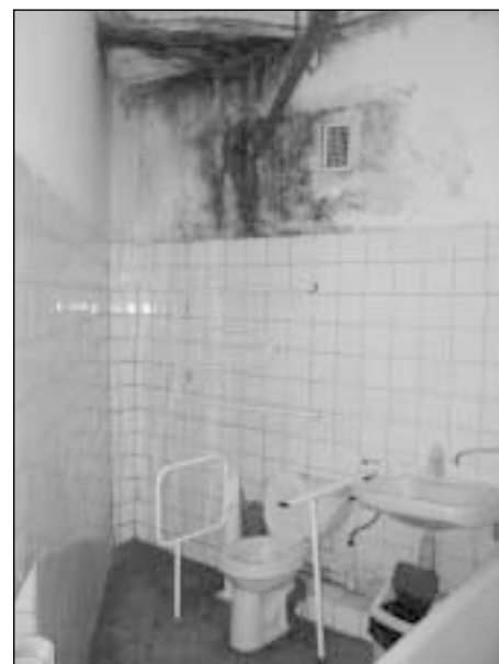
Centro turima įranga apsiriboja senais, rusiškais pavyzdžio modeliais, o patalpos seniai neregėjusios remonto

Rotaract nario nuomone, turint daugiau ir šiuolaikiškesnės įrangos būtų galima tikėtis dar geresnių rezultatų: „Visi įstaigos pacientai mažai juda arba apskritai prikaustyti prie lovos“.