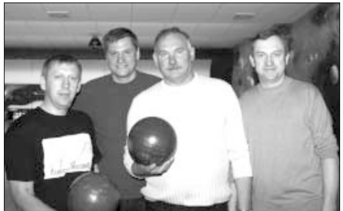
Rotariečiai tikėjosi, kad draugiškos boulingo bei šaškių varžybos padės stiprinti Rotary ir Lions klubų bičiulystę