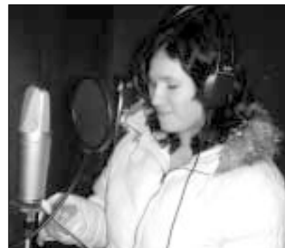
Vaikai ypač įvertino galimybę savo sukurtas dainas įrašyti profesionalioje studijoje

Bendra projekto sąmata siekia 3 tūkst. litų. Šias lėšas klubo nariai susirinko organizuodami įvairias akcijas. Nudžiuginti projekto rezultatų klubo nariai žada ir šių metų gegužę organizuojamų tradicinių „Ančiukų lenktynių“ pelną skirti projekto „Ateitis mano rankose“ tęsinui.