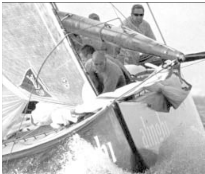
2003 m. Amerikos taurės nugalėtojai – Šveicarijos komanda su jachta Alinghi