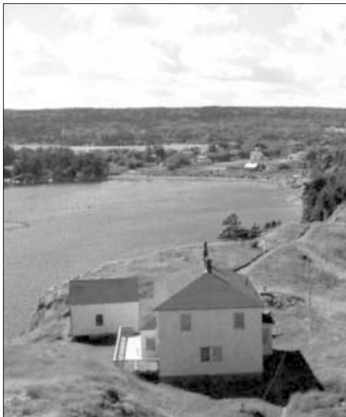
Taip Bay of Fundy apylinkės atrodo užlipus į švyturį

VIII straipsnis, I skyrius: Jeigu klubo narys išvyksta į užsienį ne trumpesniam kaip 14 dienų laikotarpiui ir gali lankytis kitų klubų susirinkimuose, tai kompensuoja praleistus susirinkimus namuose.