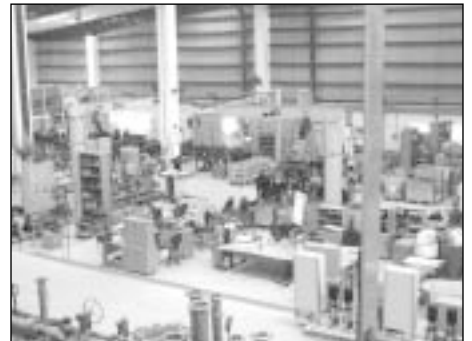
Mokyklos ir medicinos įstaigos Indijoje yra Rotary veiklos prioritetai. O modernios gamyklos byloja apie augančią šalies ekonomiką

sumokamų mokesčių, salėje visuomet kil-davo šurmuly, ir niekas nebeklausyda-vo, kas yra kalbama toliau, o imdavo tar-pusavyje diskutuoti, ar taip gali būti, gal čia sumaišyti skaičiai ir pan. Indijoje pa-jamų mokestis yra 30 proc.