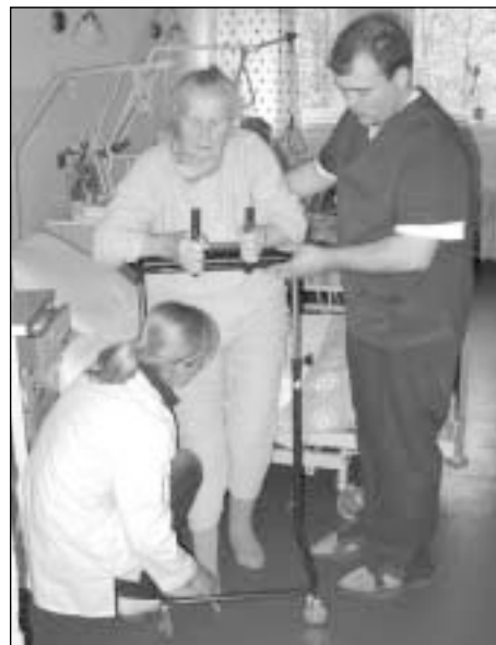
Reabilitacijos centre įrangą dažnai keičia personalas