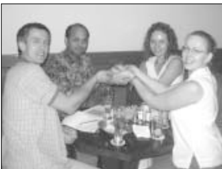
Sunkiausia GSE dalyviui gali būti išverti intensyvių bendravimų su labai skirtingais žmonėmis

Kaip ir rašiau Rotary International GSE programos ataskaitoje, šios kelionės metu Rotary neabejotinai tapo mano gyvenimo dalimi.