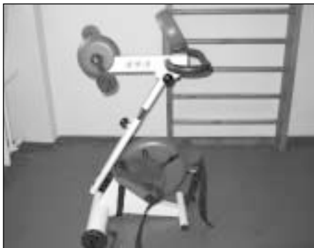
Centro darbuotojai džiaugiasi, kad nauji treniruokliai ne tik patogūs naudoti, tačiau jie taip pat demonstruoja įvairius parametrus

mo takelis, dešimt funkcinį slaugos lovų, dešimt įvairių neigaliesiems skirtų vežimėlių, trys gydomieji stalai, sudedama vaikščiojimo lygiagretė. Kadangi rotariečiai dar nėra surinkę visos reikalingos sumos, projektas yra įgyvendinamas etapais. Pirmiausia į Centrą keliauja labiausiai reikalingi įrenginiai.