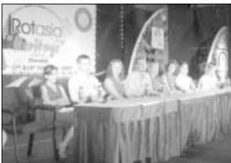
Komandos nariai per penkias savaites spėjo prisistatyti 96 Rotary klubams

Indijoje Rotary reiškia ne tik visuo-meninę veiklą. Tai taip pat tam tikra so-cialinė ir visuomeninė padėtis, ir daugu-ma narių yra labai turtingi žmonės. Tai žinojome dar prieš išvykdami iš Lietu-