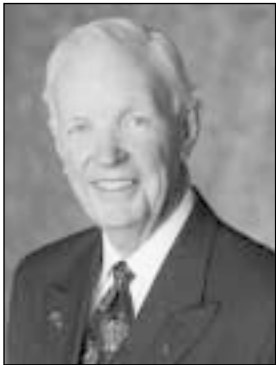
Rotarietis nuo 1962 m. Trenton RK, Kanada narys