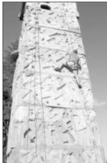
Kauno rotariečiai šturmavo trylikos metrų aukščio uolą

Užkandę lauke išsikeptos mėsytės, pajuokavę ir pasportavę rotariečiai padarė esminę išvadą – renginiai su šeimos nariais yra reikalingi, įdomūs ir prasmingi. O kad bus prasminga sugrįžti į tą pačią stovyklavietę, daugelis rotariečių neabejoja apžiūrinėdami pradėtą rengti kliūčių ruožą 10 metrų aukščio stulpų viršūnėse.