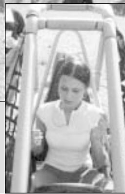
Rokiškio RK gegužės 26-27 d. organizavo šventę „Sugauk Sartų undinę“.