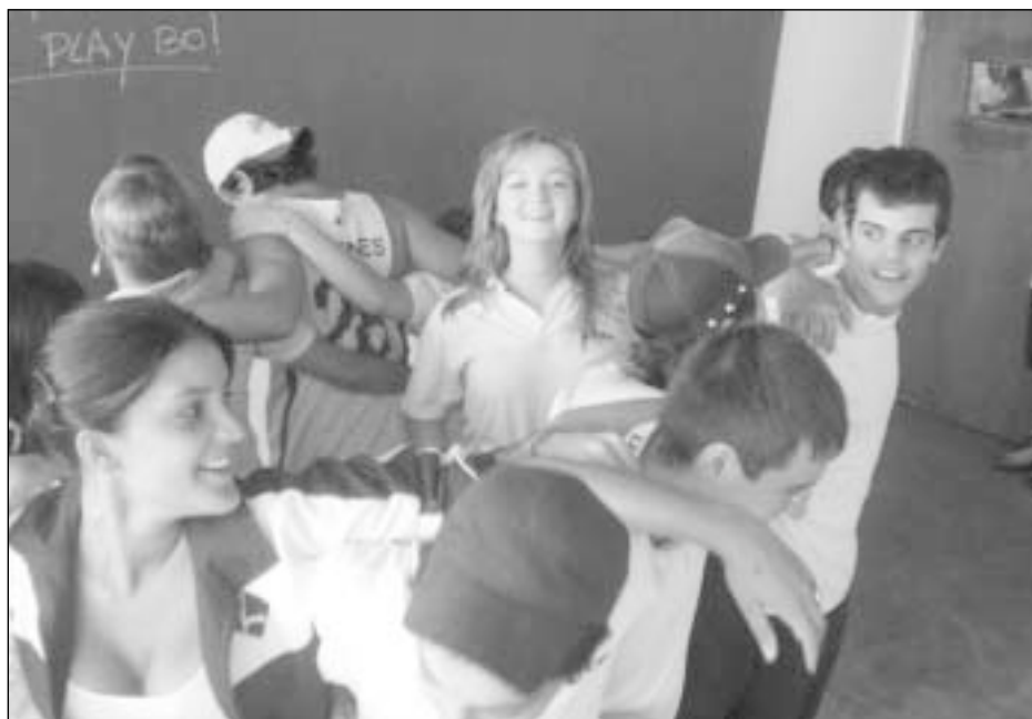
Brazilai daro tik tai, ką nori. O labiausiai jie mėgsta linksmintis. Net ir pamokų metu.

Universitetuose didžiausi kon- kursai vyksta medicinos studijoms, nes medikai Brazilijoje uždirba la- bai daug.