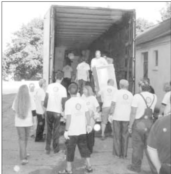
Vilnius International RK nario nuomone, rotariečiams yra daug svarbiau kartu dirbti, nei kartu pietauti

Rotariečiai tikisi, jog jau rugšėjo 1 d. mokyklos auklėtiniais duris atvers atnaujintos klasės.