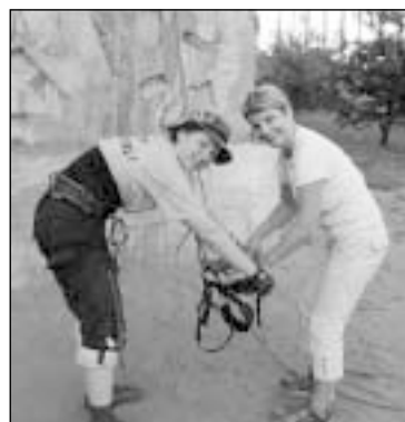
Ekstremalaus sporto bandytojus saugojo profesionalios apsaugos priemonės