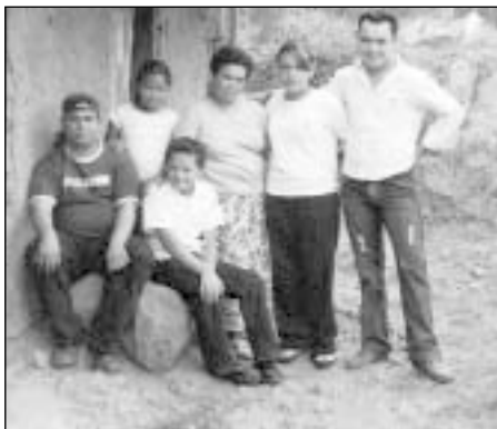
Jos šeimą vyras paliko 2001 m.