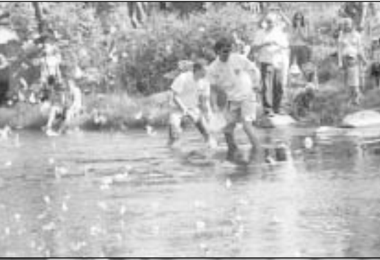
Gegužės 27 d. Vilniaus Rotaract klubas jau trečią kartą organizavo ančiukų lenktynes.