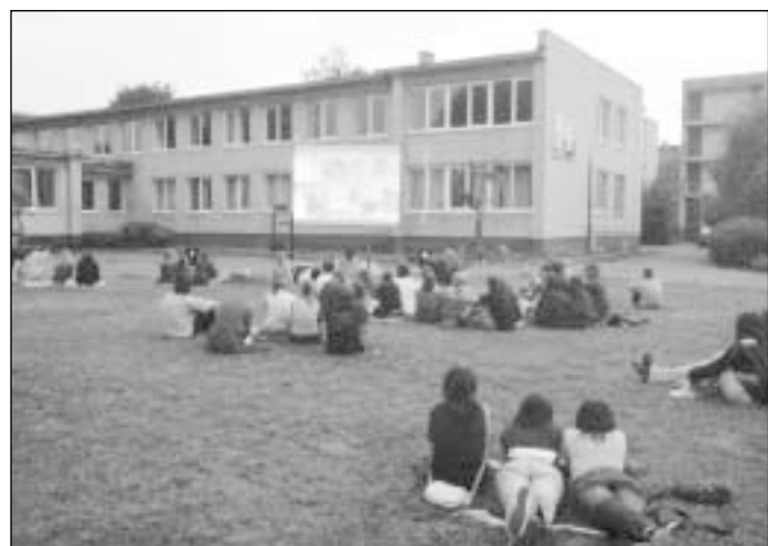
Kino buso atvežtus filmus žiūrėjo ir rotariečių pakviesti vaikai bei jaunimas