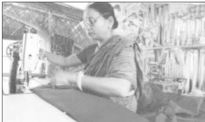
Mikrokreditas dažniausiai tampa galimybe pradėti smulkų verslą: įsigyti siuvimo mašiną ar kompiuterį, išsinuomoti prekybines patalpas, užsisakyti prekių ar pan.

kurti ir plėtoti, rotariečiai jiems taip pat organizuoja verslo kursus. Rotary nariai pastebėjo, jog šiems smulkiems verslininkams pavyksta padidinti savo pelno maržą net iki 80 proc. Tam daugiausia įtaką daro kuklios mikrokreditų palūkanos.