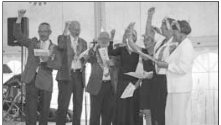
2007/08 m. valdytojai drauge su žmonėmis RI prezidentą pagerbė atlikdami Tarptautinės asamblėjos San Diego metu išminktą dainą