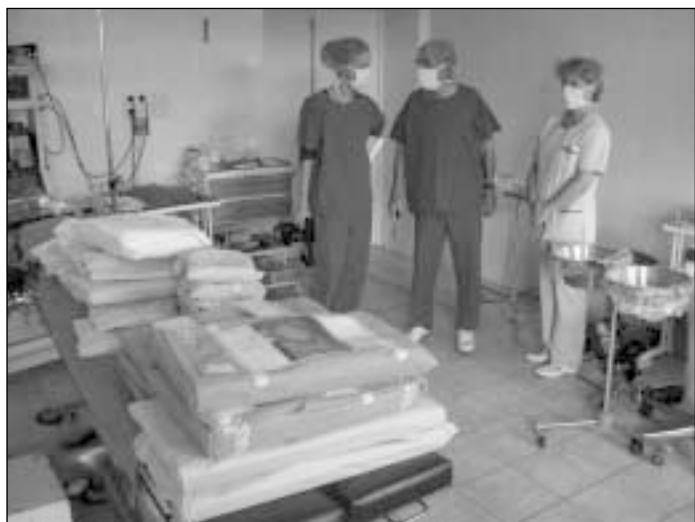
Rotary dovanota įranga skirta klubo sąnarių keitimo operacijoms atlikti