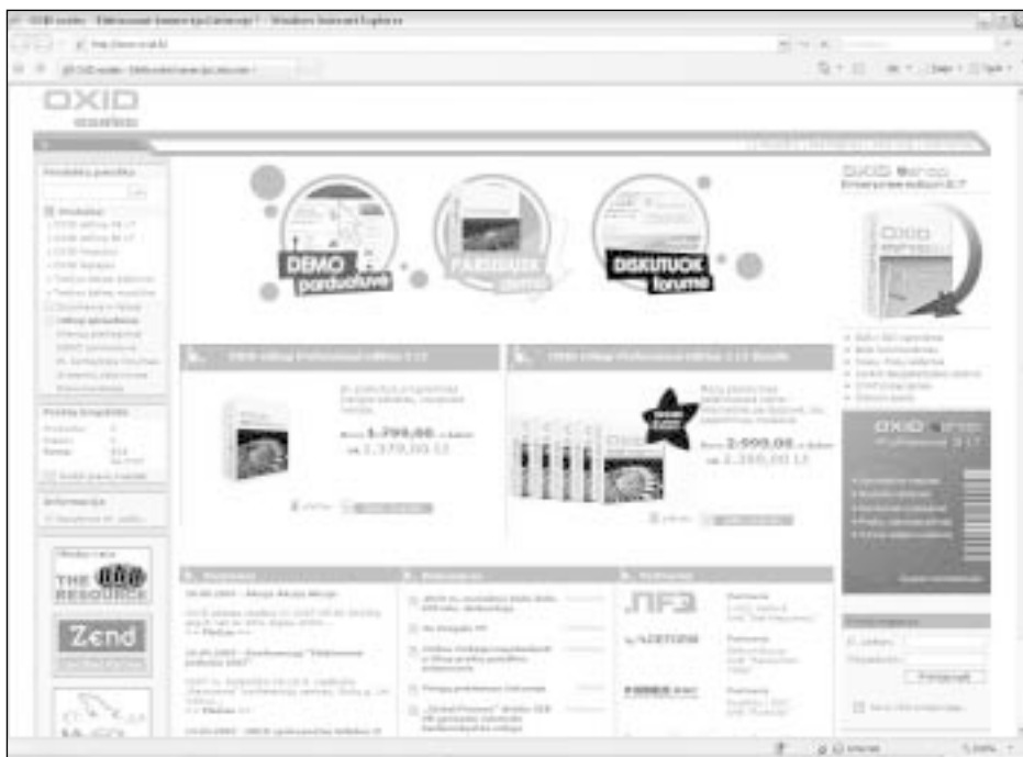
OXID eShop – viena populiariausių el. prekybai skirtų sistemų Lietuvoje

Pilnavertė elektroninė B2B sistema dažniausiai būna susieta su visais galimais procesais įmonėje: apskaitos, verslo valdymo, logistikos ir kitomis sistemomis, kurios yra automatizuojamos. Verslas-verslui sistemos yra prieinamos ir efektyvios ne tik didelėms bendrovėms, pvz. tokioms kaip „Sanitex“, kurie aptarnauja tūkstančius verslo klientų ir frančizės gavėjų per www.office1.lt sistemą. Smulkus ir vidutinis verslas taip pat noriai diegiasi B2B sistemas: pavyzdžiui, www.rol-europa.com el. parduotuvė, kurioje užsakovas lietuvis parduoda žaliuzes, kurios gaminamos Panevėžyje, o pagrindiniai pirkėjai – verslo klientai Didžiojoje Britanijoje ir Vokietijoje. Taip pat pardavėjas parduoda pavieniams pirkėjams visame pasaulyje.