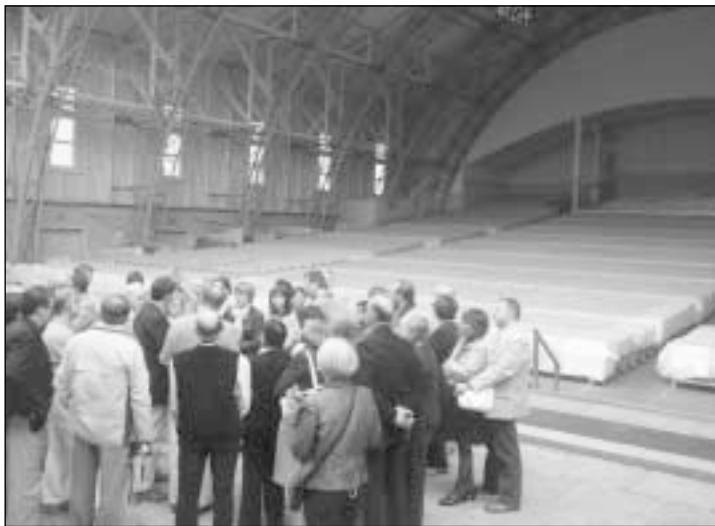
Teatro pastato konstrukcija be suvirinimų, tik kniedėmis sujungta

Oberamergau yra 900 m. virš jūros lygio. Karaliaus Liudviko II-ojo gimimo dieną ant kalno dega Karaliaus karūna, o apačioje ugnimi šviečia kryžius.