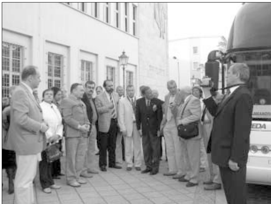
Kelionėje kauniečiai sutiko rotariečių, negailėjusių savo laiko ir dėmesio priimant svečius

1560 m. vyskupas Volfas Dytrichas, turėjęs žmoną ir 14 vaikų, savo mylimajai pastatė Mirabelės rūmus. Rūmų sodas papuoštas graikų mitologijos personažų marmurinėmis skulptūromis. Iš sodo atsiveria nuostabi panorama į Zalcburgo pilį. Šalia Mocarteumas – Mocarto muzikos akademija. Universitetas – šimtmečiu jaunesnis nei mūsų VU. Koncertų salės, kurioje vyksta Mocarto muzikos festivaliai, scena – uoloje. Salė