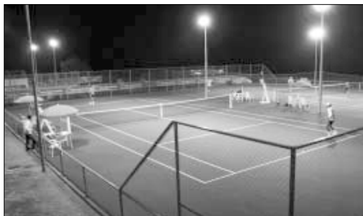
Žaisti teko ir per dienos karščius, ir vėlais vakarais