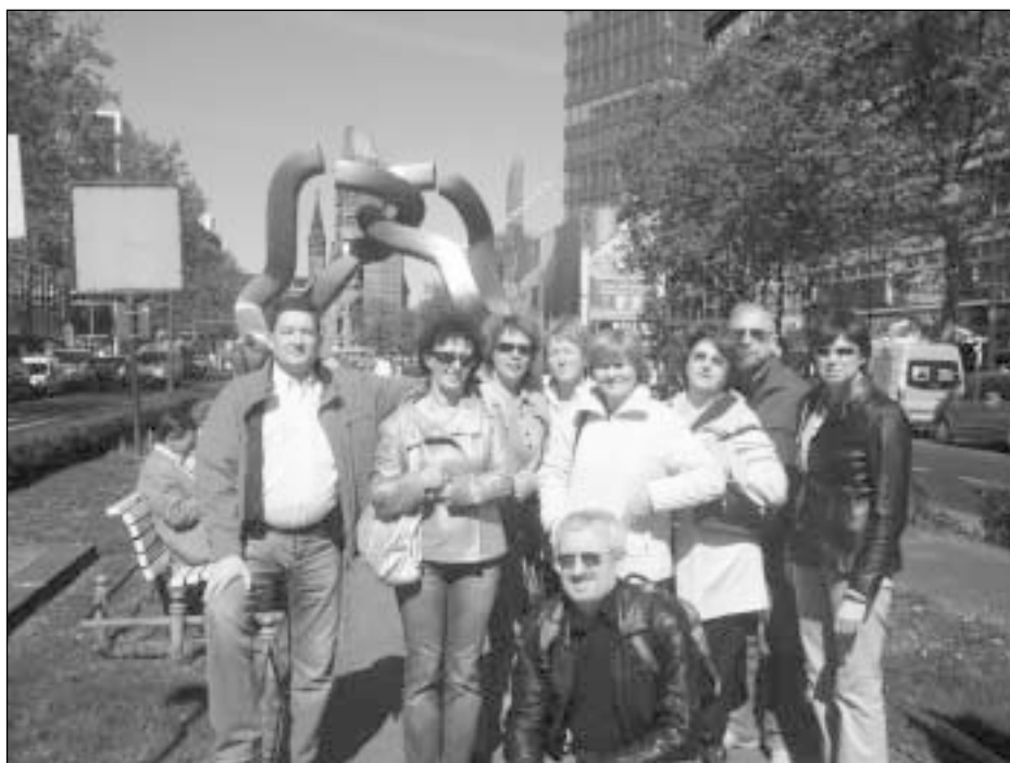
Berlyne rotariečiai išiamžino kontrastų fone: modernus menas ir karo baisumus mininti bažnyčia be stogo

Miunchenas – miestas pietų Vokietijoje, prie Izaro upės, turintis 1,25 mln. gyventojų. Tai Bavarijos sostinė. Bavaras pirmiausia pasakys, kad jis bavaras – o tik paskui, kad vokietis. Labai gražus jų pasisveiki-