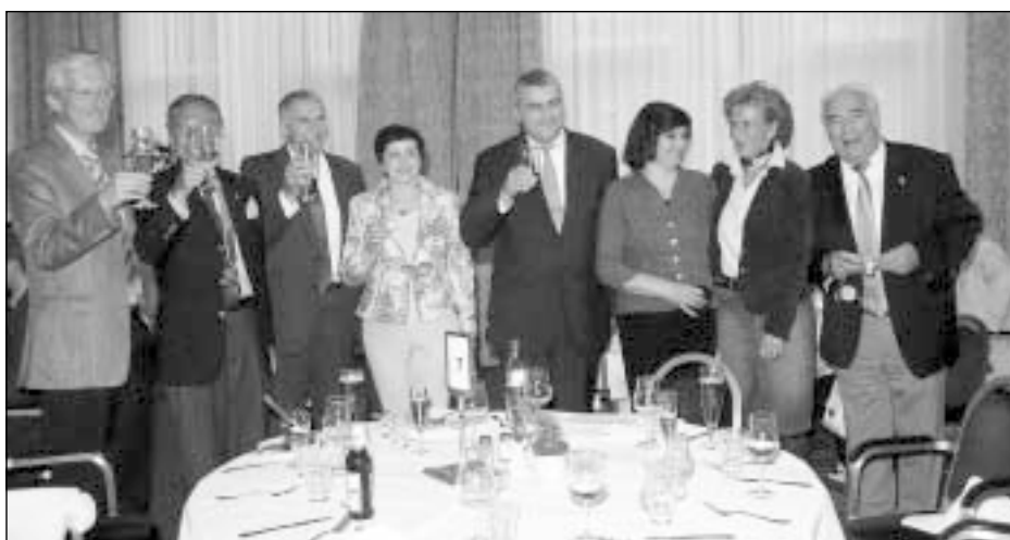
Seni draugai šiltai sutiko Magdeburg Rotary klube